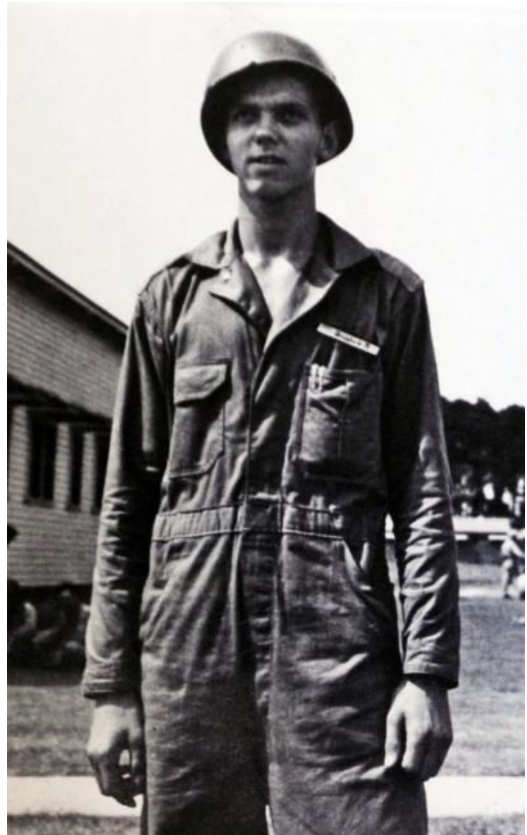
Le prince Michel de Boubon-Parme, à 17 ans, engagé volontaire en formation à Fort Benning, aux USA, pour libérer la France.

À leur seconde tentative d'évasion, après huit mois d'une détention éprouvante, ils parviennent à s'enfuir et gagnent la jungle du Laos. Trois mourront lors d'embuscades, un quatrième victime d'un tigre, et ils ne seront que deux à rejoindre la frontière thaïlandaise.